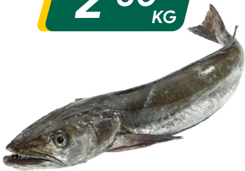
MERLUZA NEGRA CERRADA Carioca