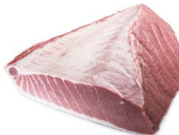
VENTRESCA DE ATÚN