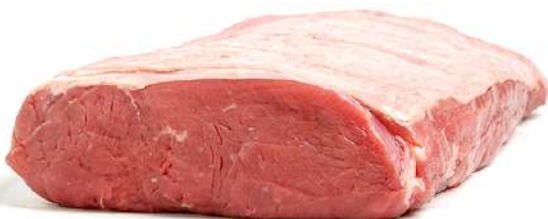
LOMO DE TERNERA ROSADA 1ª A