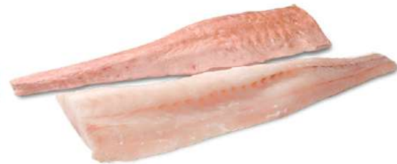
FILETE DE ROSADA