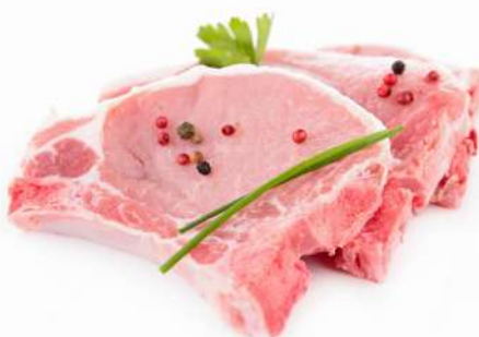
CHULETAS DE LOMO TIERNAS