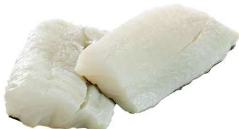
FILETE DE BACALAO al punto de sal