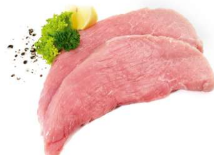
FILETES DE JAMÓN