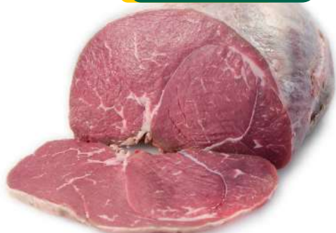
FILETE DE BABILLA DE AÑOJO 1ª A