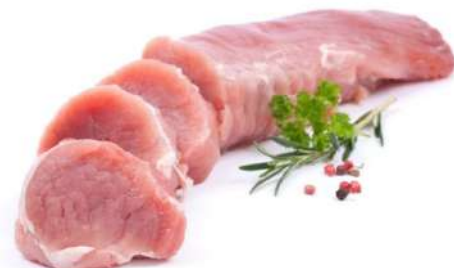
FILETE DE CINTA DE LOMO