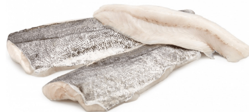
LOMO DE MARRAJO